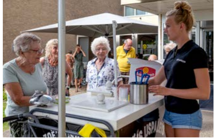
Ijsjes traktatie Almenum zomer 2022

Wij staan op maandag 17 juli om 15.00 uur met de ijscokar bij de hoofdingang en bij slecht weer binnen.